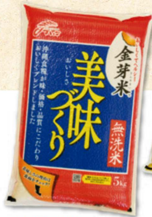
金芽米美味づくり 5kg