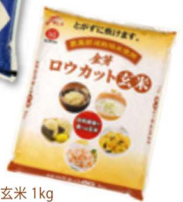
金芽ロウカット玄米 1kg